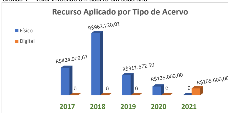
Gráfico 1 – Valor investido em acervo em cada ano